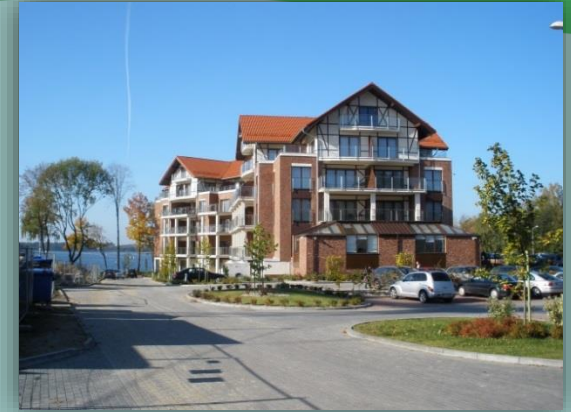
Willa Port Resort